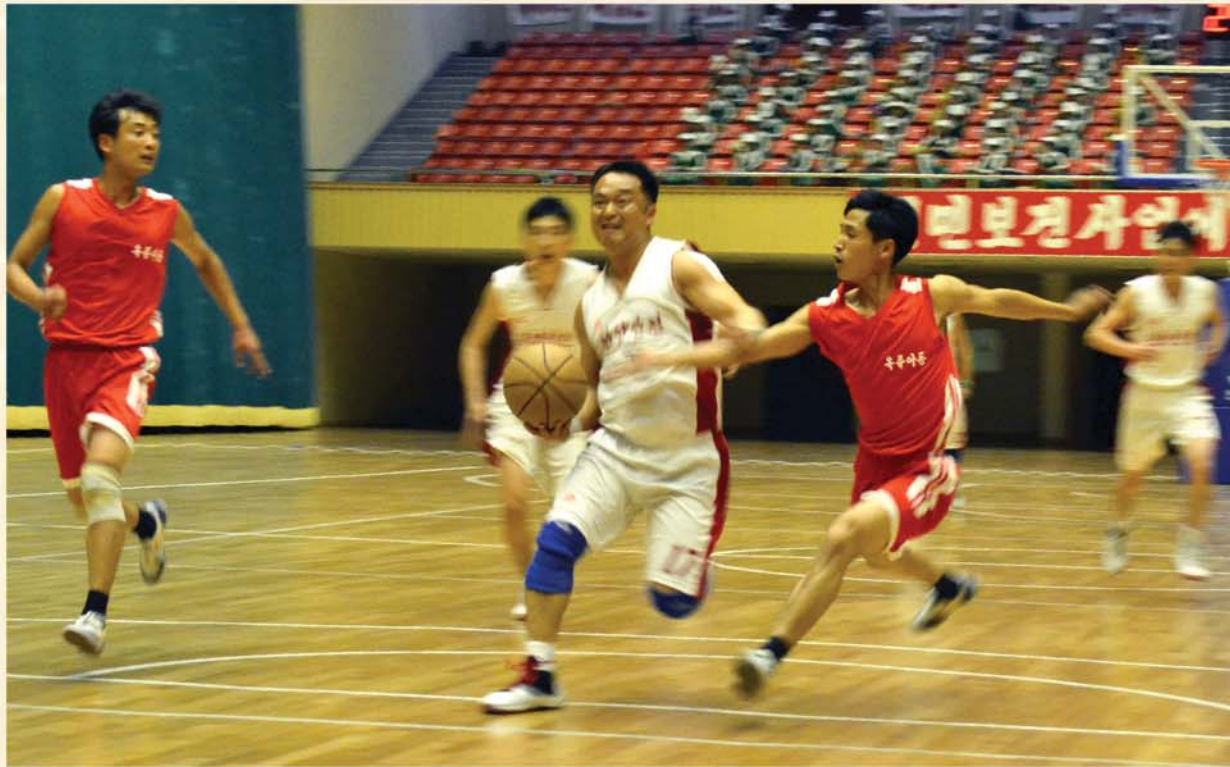
При участии в III Спартакиаде работников здравоохранения.