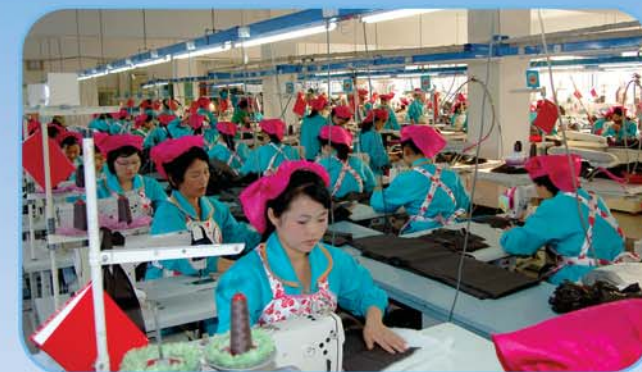
Рабочие Сукчхонской швейной фабрики «Чинсон».

До освобождения страны здесь имелось небольшое деревенское село с разбросанными крестьян-