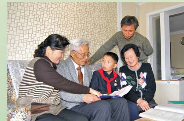
Со своей семьей.