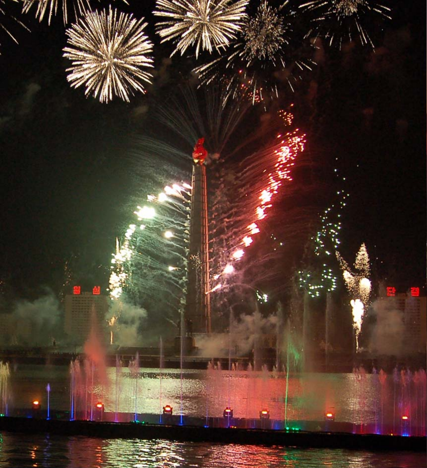
Салют ликования.

Над Монументом идей чучхе взлетает фейерверк салюта, окрашивая ночное небо. Разноцветные огни приукрашают ночной Пхеньян, как бы отражая ликование достойно живущих людей нашей Родины, где проводится политика отдачи приоритета народу, его уважения и любви к нему.