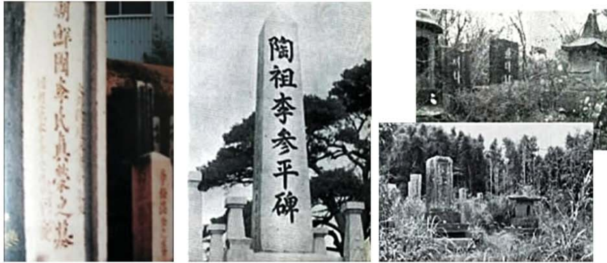
Часть могил похищенных корейцев-специалистов.

►остались целыми даже королевские могилы». Сгорело много книг, сохранявшихся в центральных ведомствах Хонмун, Чхунчху и др., были разрушены и сожжены дождемер и другие измерительные аппараты, разные музыкальные инструменты.