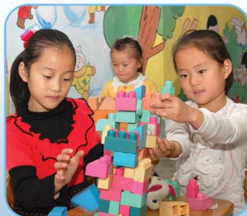
В Сукчхонском детсаде.