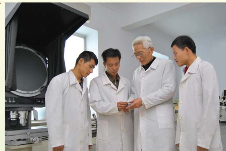
Вместе с молодыми научными сотрудниками.

шенной промышленной школы в Японии одобрил его решение репатрироваться для учебы. На Родине он поступил в Политехнический институт имени Ким Чака ( в то время ) и расширял свои знания, а после его окончания вел в НИИ трудную, но плодотворную исследовательскую работу.