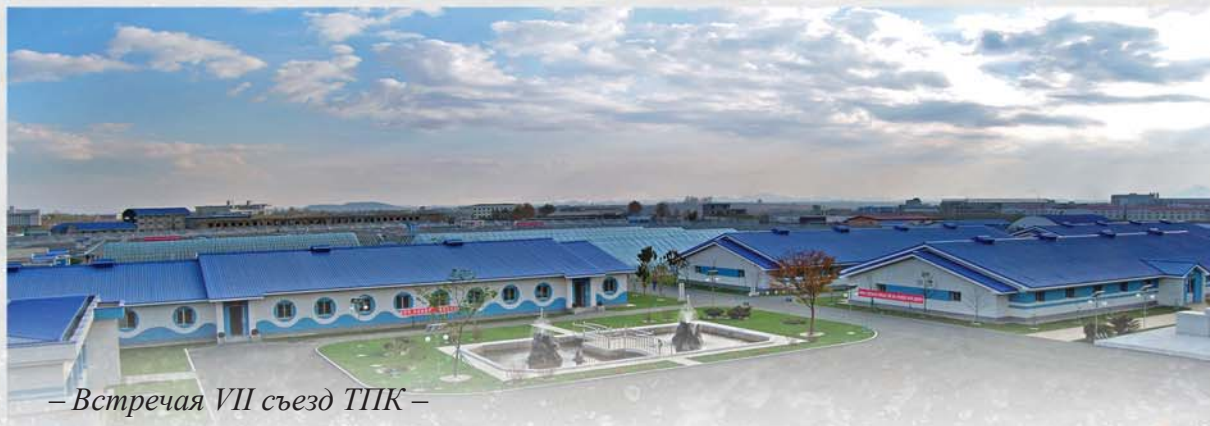
– Встреча VII съезд ТПК –