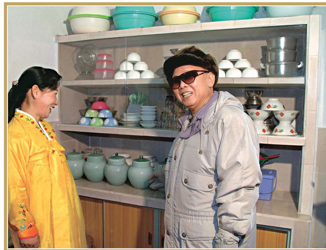
Полковнец Ким Чен Ир посетил семью демобилизованных молодоженов, справивших новоселье (октябрь 2009 г.).