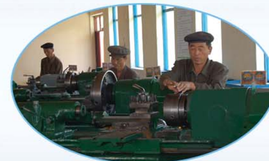
Сукчхонская уездная станция сельхозмашин.