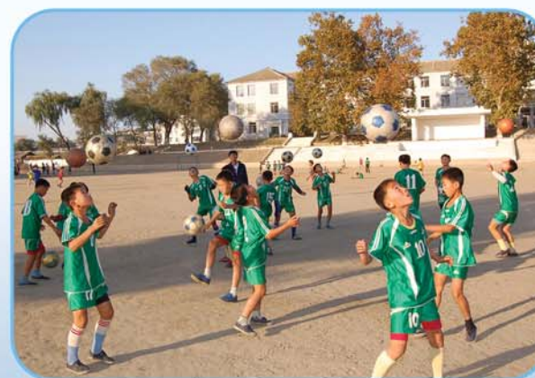
Учащиеся Сукчхонской полной средней школы-героя.