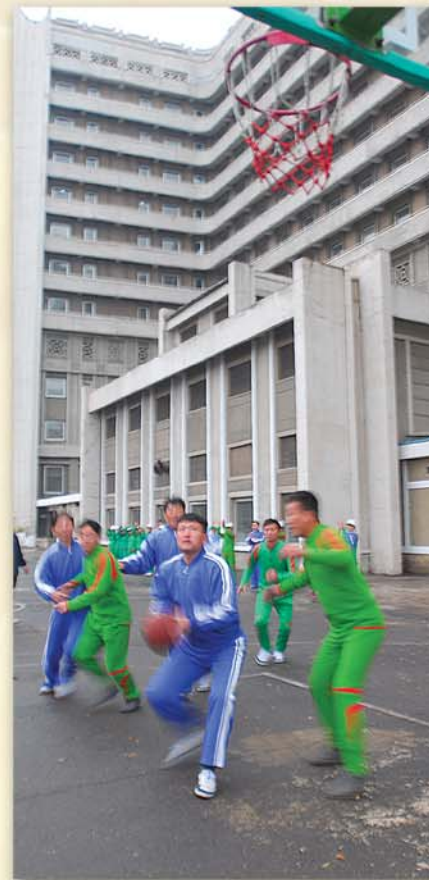
Игры часто проводятся и между отделениями.